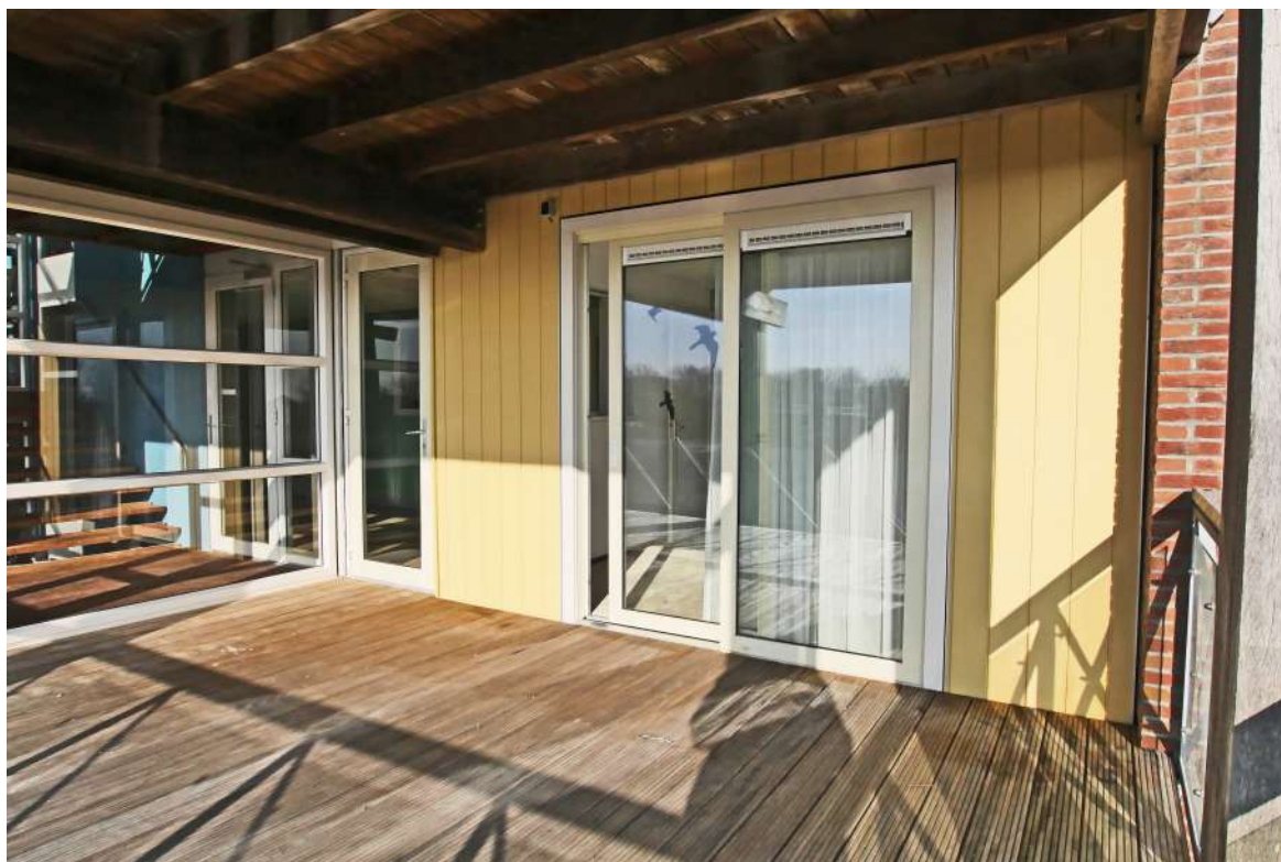
Slaapkamer aan het terras