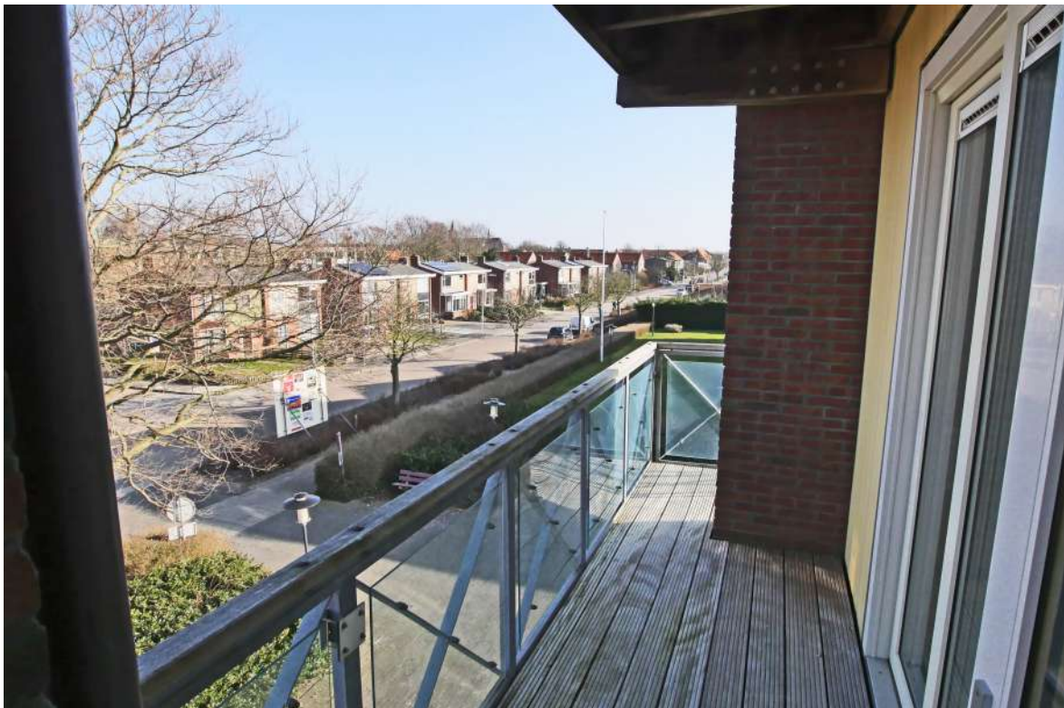
Balkon aan de voorzijde