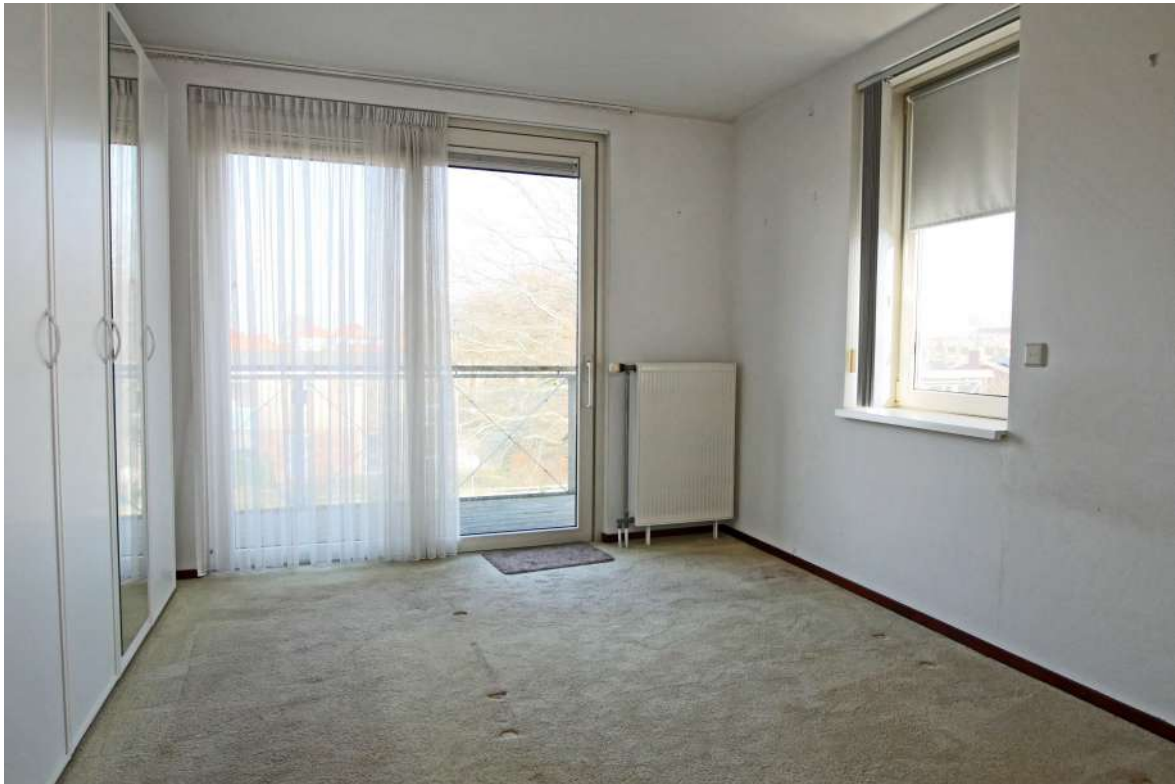
Ruime slaapkamer voorzijde naar balkon