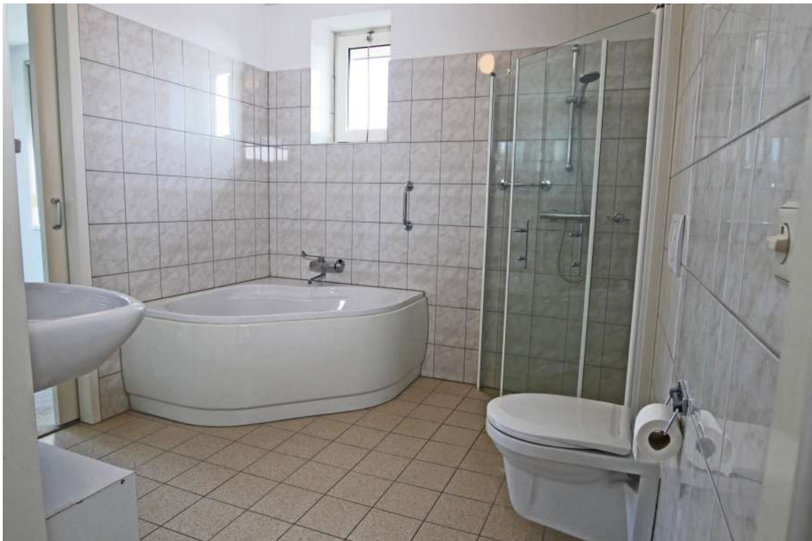
Zeer royale badkamer