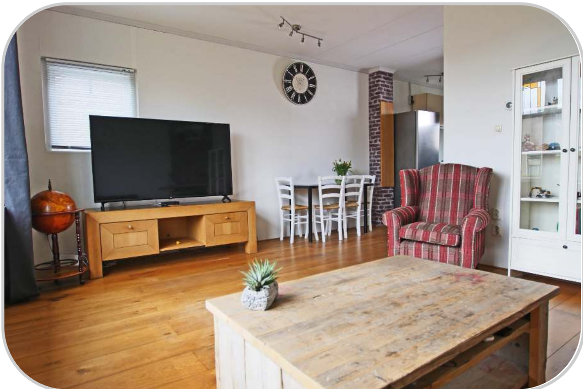
Woonkamer met doorloop naar de keuken