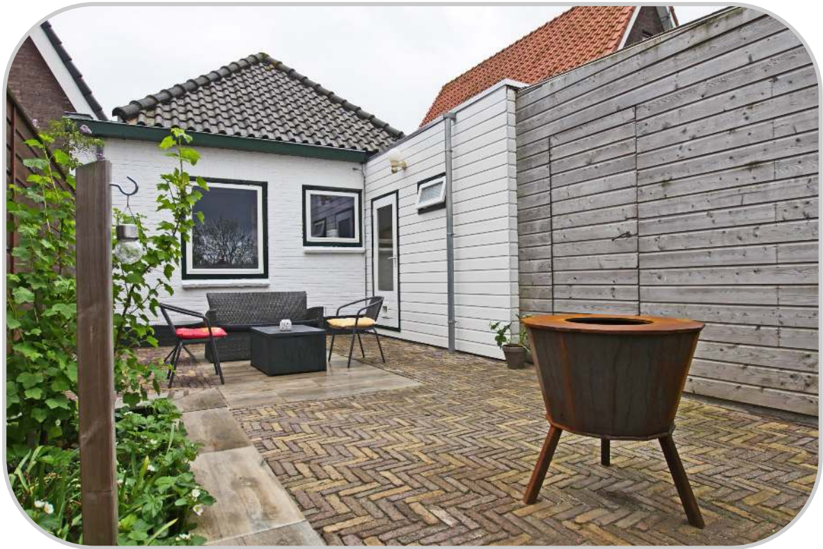
Tuin met zicht op de achtergevel