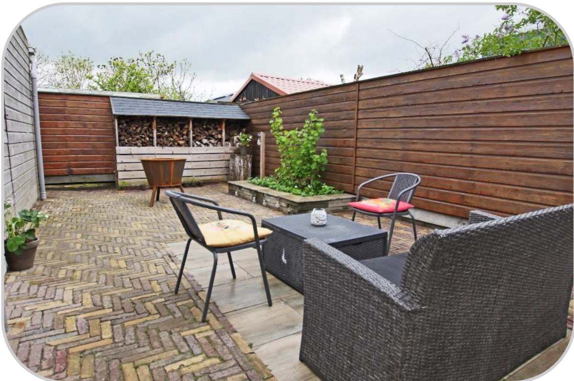
Tuin met houthok