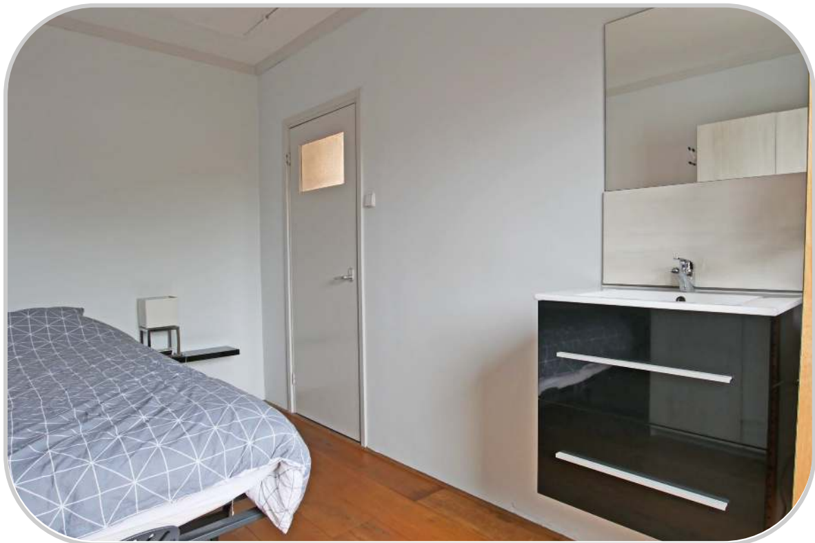
Slaapkamer met wastafel