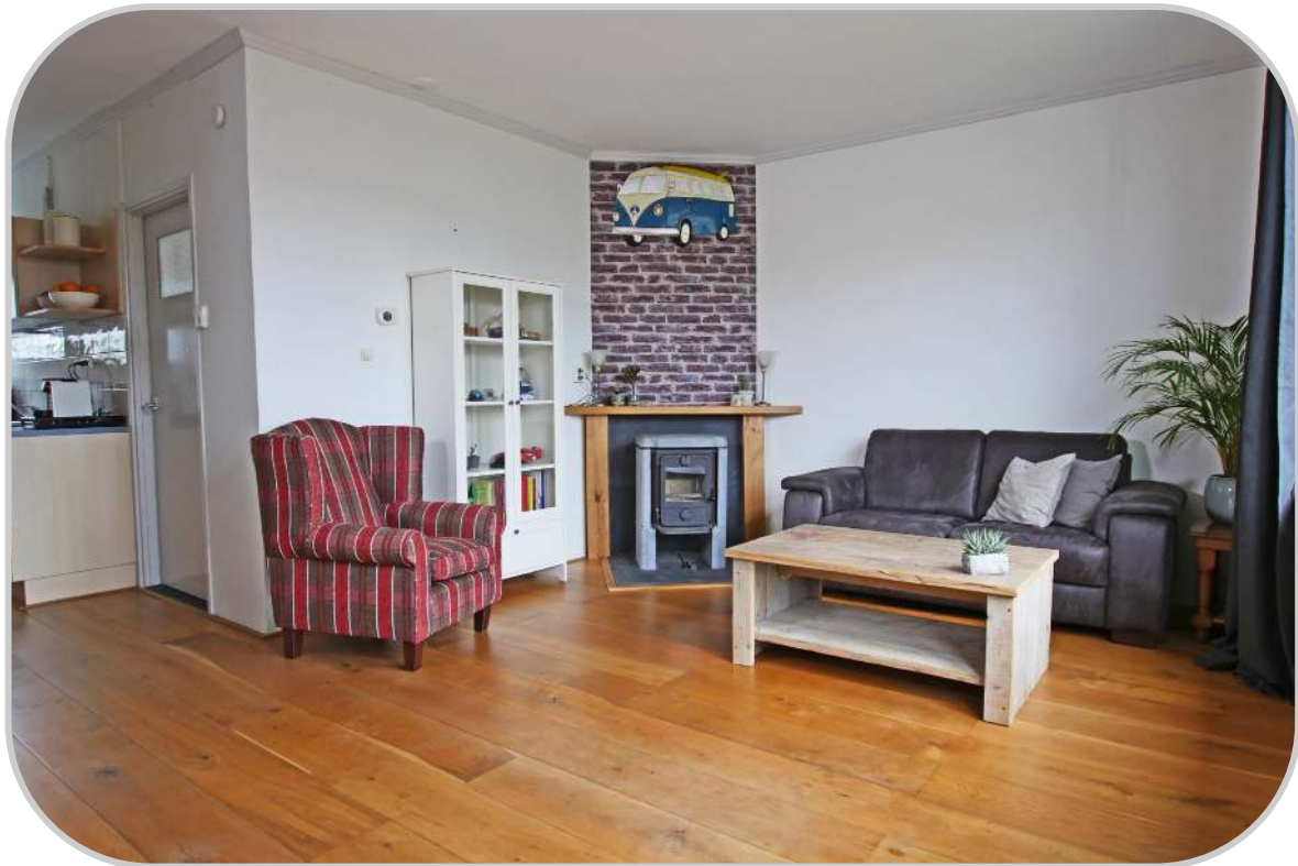
Woonkamer met zicht op de schouw