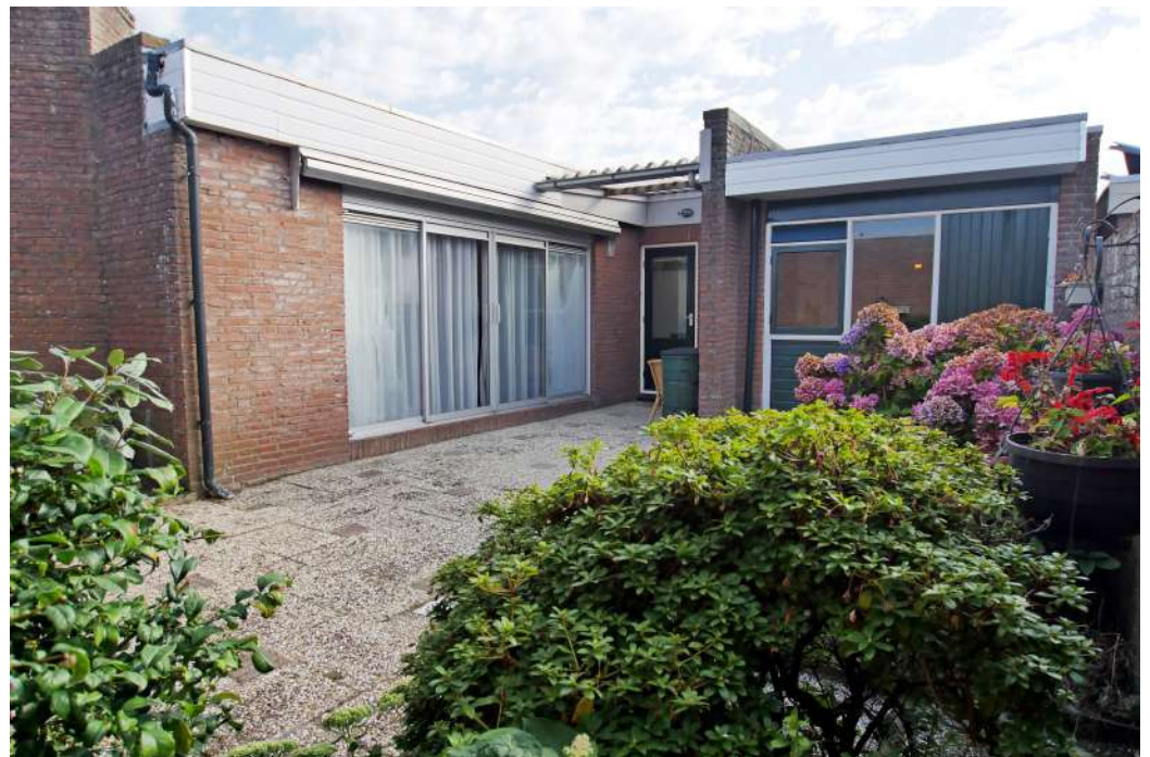
Terras grenzend aan de woonkamer.