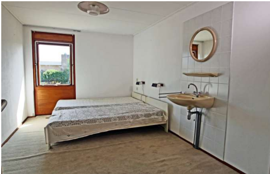
Slaapkamer met inbouwkasten en Wastafel.