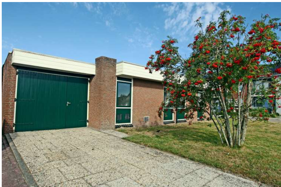
Zeer grote verlengde garage met eigen oprit.